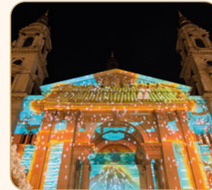
TAG 5: BUDAPEST

Am späten Nachmittag kehren Sie zum Zug zurück, wo ein festliches Abschiedsmenü auf Sie wartet. Genießen Sie den Abend im Barwagen mit einem Glas Wein und den Klängen unseres Pianisten, bevor Sie sich in Ihr Abteil zurückziehen.