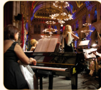
TAG 3: GRAZ

Am Nachmittag erreichen Sie Salzburg, die Stadt Mozarts. Hier erwartet Sie eine romantische Kutschfahrt durch die Altstadt, die Sie zum Schloss Mirabell führt, einem barocken Juwel und UNESCO-Weltkulturerbe, das durch den Film „The Sound of Music“ weltberühmt wurde. Anschließend besuchen Sie den Salzburger Christkindlmarkt, der zwischen Dom- und Residenzplatz liegt und zu den schönsten Weihnachtsmärkten der Welt zählt. Der Abend klingt im Barwagen des Zuges aus, wo Sie bei einem Glas Wein oder Cocktail den Klängen unseres Pianisten lauschen und sich mit Ihren Mitreisenden austauschen können.