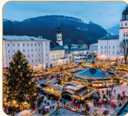
TAG 2: SALZBURG

Am Abend genießen Sie ein exquisites Dinner in einem ausgewählten Restaurant der Altstadt, um den Tag in gemütlicher Runde ausklingen zu lassen.