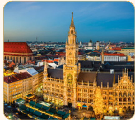
TAG 1: MÜNCHEN