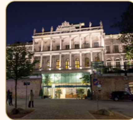
TAG 4: WIEN

Am Abend erreichen Sie Wien, wo ein privates Konzert des Vienna Supreme Orchestra auf Sie wartet. Lassen Sie sich von den harmonischen Klängen der Wiener Musik verzaubern, bevor Sie in Ihr gemütliches Abteil zurückkehren.