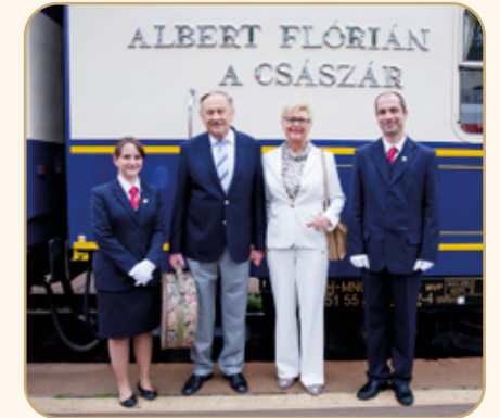
TAG 6: HEIMREISE

Nach dem Mittagessen besuchen Sie die ungarische Staatsoper, wo Sie eine Führung durch das prunkvolle Gebäude erwarten. Anschließend checken Sie in Ihr Fünf-Sterne-Hotel ein, das der Musik gewidmet ist. Der krönende Abschluss Ihrer Reise ist eine Dinner-Kreuzfahrt auf der Donau – ein unvergessliches Abschiedsessen bei Kerzenschein, während die Lichter Budapests an Ihnen vorbeiziehen.